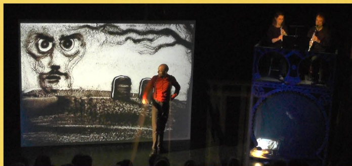
DON GIOVANNI, première à la Source : la statue du commandeur